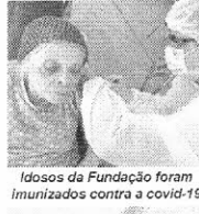
Idosos da Fundação foram imunizados contra a covid-19