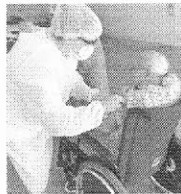
Idosos foram vacinados nesta semana